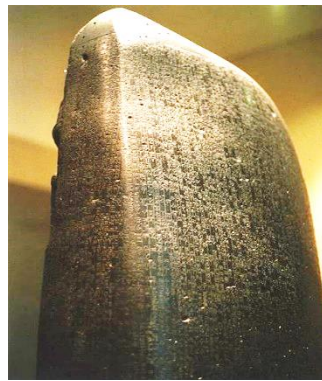
Gambar. Inskripsi Hukum Hammurabi

Ketetapan Yobel memiliki kedekatan dengan Hukum Hammurabi. 20 Hukum ini menjalankan misharum bagi pendudukan Babel. Hukum Hammurabi merupakan kumpulan hukum termasuk misharum dalam masa empat puluh tiga tahun pemerintahan Hammurabi yaitu pada tahun 1792 – 1750 S.M, raja ke enam dari Dinasti Babel yang pertama 21 . Raja ini melakukan ekspansi politis dengan menyusun kekuatan birokrasi yang rumit beserta kekuatan militer yang kompleks. Dia menaklukkan kerajaan-kerajaan besar yang menjadi saingannya dalam melebarkan sayap kekuasaan serta meluaskan pengaruh melalui hubungan diplomatik di daerah Timur Dekat Kuno. 22